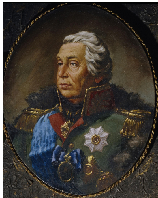
М.И. Кутузов 1745-1813